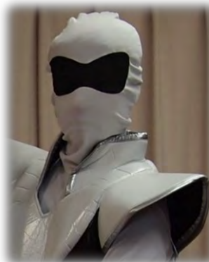
ダンサナクセイバー・ムジ